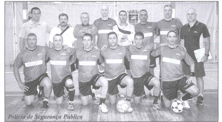
Polícia de Segurança Pública

Realce-se o fair play demonstrado por todas as equipas e a importância da continuidade deste torneio pelo seu caráter de inclusão e fortalecimento das relações entre entidades concelhias e os seus colaboradores, o que garante cooperação entre quem presta serviço público à comunidade vilacondense.