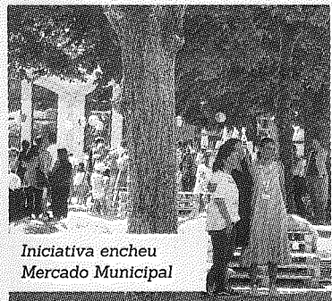
Iniciativa encheu Mercado Municipal